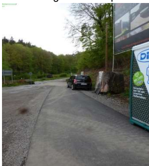
5-4 Radweg neben Parkplatz zum Schweinstal