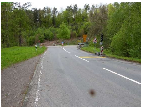
1-1 Blick von Karlstal L 500 auf B 270