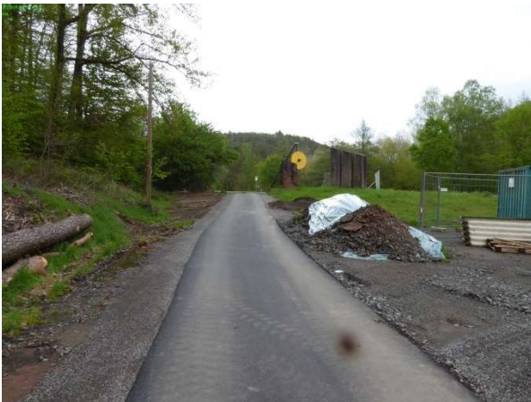
5-2 Radweg vorm Parkplatz