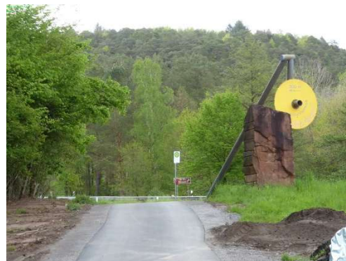
5-3 Buckel auf Radweg zum Parkplatz