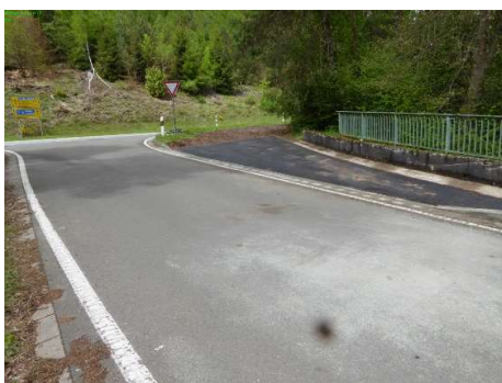
1-3 Aufstellfläche Groß