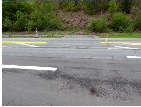
4-1 Hier soll Querung über B 270 erfolgen