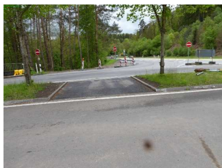
2 Querung des Verkehrsteilers