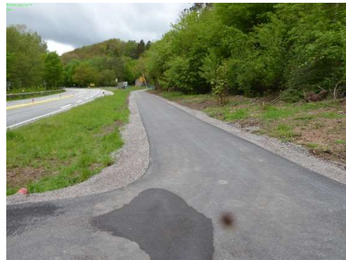
5-1 Radweg neben B 270 zum Parkplatz