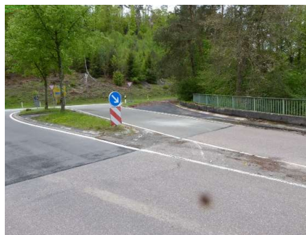
1-2 Aufstellfläche und Querung Verkehrsteiler