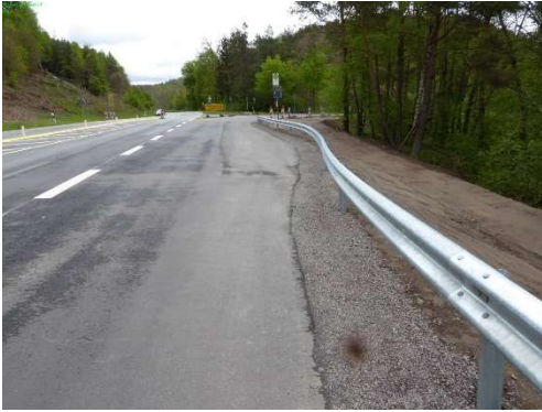
3. Führung auf Rechtsabbieger im Gegenverkehr ?, Trennung durch Leitplanke fehlt noch