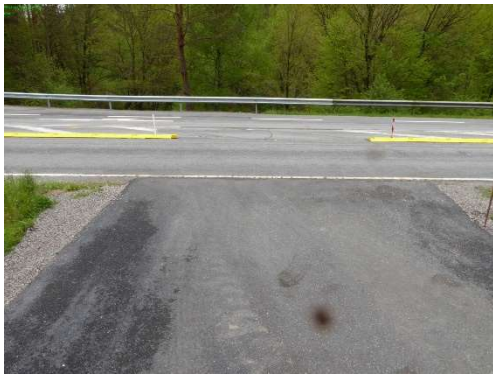
4-2 Stelle von Querung B 270, mal sehen was da kommt